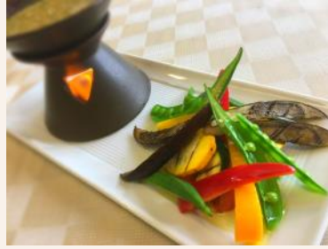
『たっぷり夏野菜のバーニャカウダ』 1,404円 石岡ゴルフ倶楽部(茨城県)

食欲が落ちてくるこの時期にお薦めです。夏野菜をたっぷり盛り込んだバーニャカウダで美味しく栄養補給してください！調理長代理: 東ヶ崎