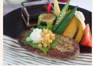
『和風おろしハンバーグ 夏野菜を添えて』 1,620円 竹原カントリークラブ(広島県)

食欲が落ちてくるこの時期にお薦めです。夏野菜をたっぷり盛り込んだバーニャカウダで美味しく栄養補給してください！調理長代理: 東ヶ崎