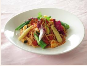
『夏野菜のトマトパスタ』 1,350円 石岡ゴルフ倶楽部 ウエストコース(茨城県)

夏野菜は、ビタミン、ミネラルが豊富で栄養価が高いだけでなく、身体を中から冷やす効果があるといわれます。アコーディアのゴルフ場では、旬の野菜をたっぷり使った料理をご用意してお待ちしています。是非、ご賞味ください！