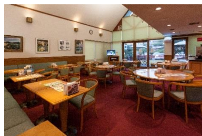
アコーディア・ガーデン東京ベイ (東京都大田区)

そして、今後も、ゴルファーの皆さまにとって、ゴルフ場やゴルフ練習場がより楽しいものになるようなサービスを開発、提供してまいります。