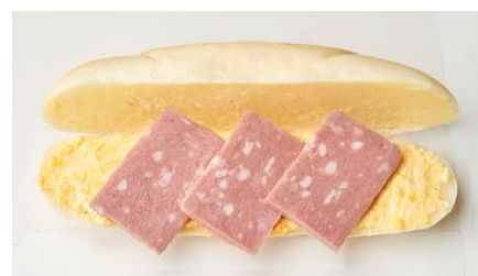
コメダ謹製やわらかシロコッペ ポークたまご 390円