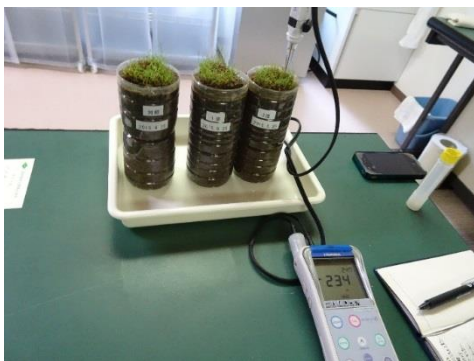
資材の投入により、還元性を示している様子 (アコーディア・ゴルフ 技術開発研究所にて)