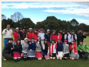
4期生ラウンドデビュー 集合写真

人数： 22名(女性) 平均年齢： 29.47歳 活動期間： 2018年7月～12月 活動場所： アコーディア ゴルフスタジオ(赤坂/御徒町)、アコーディア・ガーデン東京ベイ、ノーザンCC錦ヶ原G場、おおむらさきGC