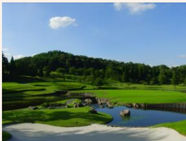
標高500mを超える18Hの丘陵コース

昨年に引き続きクチコミ総合ランキングでグループ1位に選ばれました！各部門の評価が高く、特に「食事が美味しい」部門で圧倒的なご支持をいただいております。是非ご来場のうえ、自慢の料理をご賞味ください。