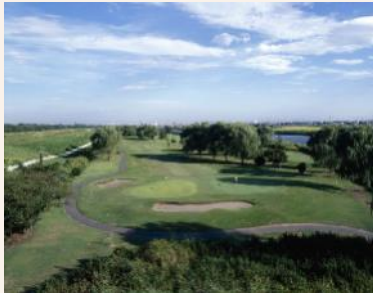
抜群のアクセスを誇るワイドな43ホール

与野ICより約8kmと都心からほど近く、電車でもアクセスできることもあり、老若男女問わずあらゆるゴルファーに親しまれています。定期開催しているキッズコンペも毎回大人気！（次回は1月13日開催予定）