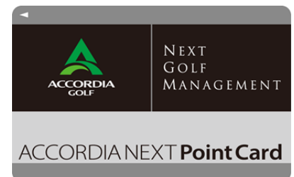
ACCORDIA NEXT ポイントカード

※ネクスト・ゴルフのゴルフ場は10月7日(水)の出島ゴルフクラブ(茨城県)から順次拡大予定