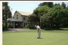
パッティンググリーン