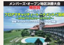
女子プロとのプロアマチャリティの招待も