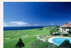
全国決勝大会の会場 ザ・サザンリンクスGC (沖縄県島尻郡八重瀬町)