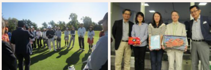
[過去開催時の様子]