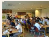
多くの参加者で賑わう表彰式の様子