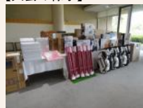
クラブや家電などの豪華賞品が並ぶ