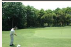
アプローチエリア