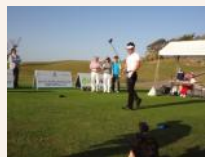
前回プロチャレンジの様子