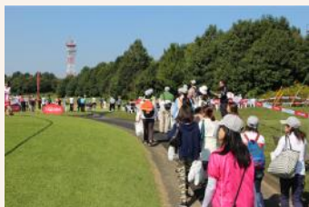
女性中心のL-Style観戦ツアー