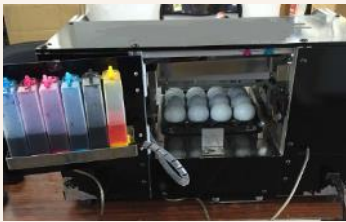
その場でオウネームが印刷できるプリンター

※イラストの種類によっては、プリントできない場合もありますので、スタッフまでご相談ください。