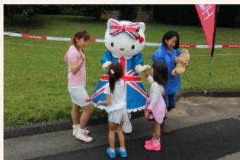
キティちゃん和ハイタッチ!

また、大人気だったのは「ハローキティイベント」。キティちゃんとのロングパット対決をしたり、写真撮影をしたり、子供たちの笑顔がはじけました。残念ながら、トーナメント会場で見守る姿を見ることはあまりありません。「キティちゃんに会いたい!」という理由で会場に足を運んでくれた子供たちも、ゴルフ場の美しさとゴルフのおもしろさを感じてくれたはず。ぜひ。