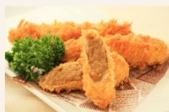
大人気だったカツカレー棒

僅差の2番人気は、肉巻きおにぎり。その他、ジューシーメンチカツ、気温の下がった最終日に数を伸ばしたスープ類が人気でした。メニューの多くは、過去にゴルフ場で提供し好評だったメニューを厳選したもの。今年、食べ損ねたあなた! 1年後には、忘れずに食べてみてくださいね!