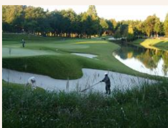
大会中のコース管理作業の様子