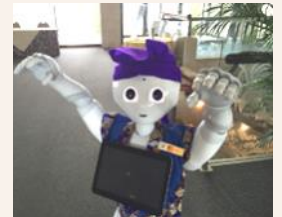
得意のダンスで接客