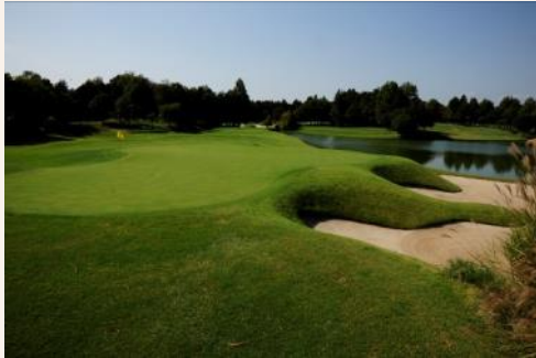
No.17 (Par3) 184yds

昨年、沖野克文選手がホールインワンを達成した池越えのショートホール。また、最終日、2位と僅差だったイ・キョンファン選手が圧巻バーディで振り切り、勝利を決定づけたホールでもあります。今年もここで、劇的瞬間が見られるチャンスです。さらに、今年もグリーン横にて、ゴルフ場レストランを運営するグループ会社「ハーツリー」がミニギャラリープラザを出店します。昨年、あの「カツカレー棒」を食べ損ねた方は必須ですよ！ 趣向を凝らした美味しいオリジナルメニューがたくさんあるので、つつい4日間通ってしまうかも？