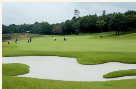
昨年もフェアウェイを逆目に刈ることにより、ランを出にくくしていました。今年もバンカー、名物ブッシュなど、随所で見られるプロの技は必見です。

コースの難易度を上げるため、大会中はすべてのフェアウェイを「逆目」に刈っています。その他、フェアウェイの水はけをよくするため排水工事(暗渠)、バンカーの形状を開場当初の状態に戻す工事を行いました。これで、プロを迎えうつ準備は万全です！