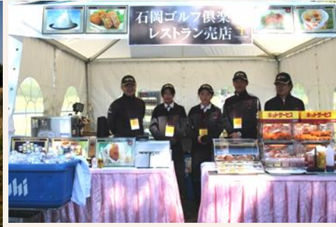
No.17 グリーン横 ミニギャラリープラザ 「石岡GCレストラン売店(昨年の様子)」