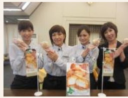
ギフトカタログ 山の原GC(兵庫県)おすすめの生クリームシュー