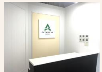
アコーディア ゴルフスタジオ御徒町 受付

URL： http://www.accordia.jp/practice/index.php (ゴルフスタジオ御徒町のページは10/15にオープン。)