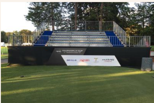
No.1 (Par4) 352yds ティグラウンド

今年は1番ホールのティグラウンドに、バックスタンドを設置しました。スタートホールでプロの豪快なティショットをより間近で見られるようになるので、おススメの観戦スポットです！