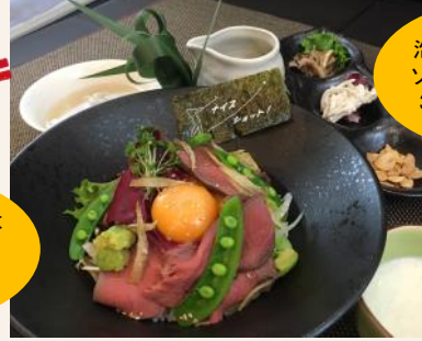
泡豆腐とバジルソースのタレで、3度楽しめる！