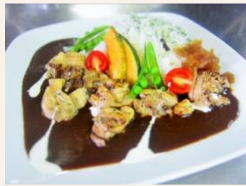
習志野カントリークラブ 空港コース(千葉県) 『二代目 空港カレー』864円