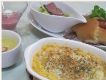
佐原カントリークラブ (千葉県) 『レディースランチ』1,512円

公式サイト「アコーディアWeb」のレストランページ「今月の逸品グルメ」では、ゴルフ場レストランで活躍する女性店長がおススメする、各ゴルフ場自慢のメニューが勢ぞろい。今月は「東日本編」です。メニューには、お客様に喜んでもらえるような、女性ならではの工夫が盛りだくさん。今回のアコナビで掲載するこの4つのゴルフ場の他にも、「今月の逸品グルメ」(下記URL参照)では女性店長たちが人気のメニューを多数ご紹介しておりますので、ぜひチェックしてください。来月公開予定の「西日本編」もお楽しみに！