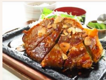
セントラルゴルフクラブ NEWコース(茨城県) 『鉄板とんてき』1,620円