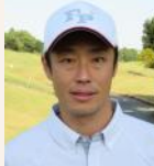
レッスンイメージ(上)