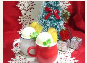
土浦カントリー倶楽部(茨城県) 『自家製さつまいもアイスのミニパルフェ』540円