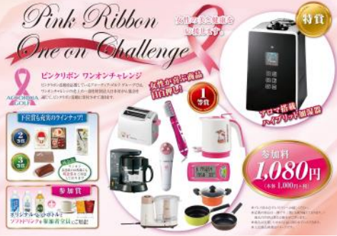
※賞品画像はイメージです

期間：2016年11月1日(火)～12月31日(土) 場所：全国の運営ゴルフ場レストラン ※一部開催していない店舗あり 参加料：1,080円(税込) ※売上の一部を日本対がん協会に寄付します