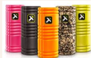
グリッドローラー(上) golfrevoの店舗の様子(左)