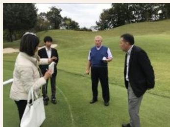
PGAオフィシャルの視察の様子