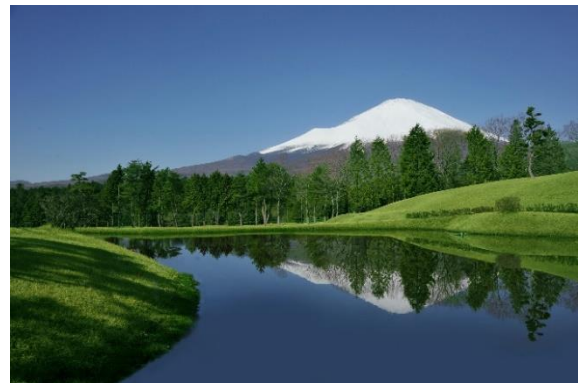
7月13日(金) リニューアルオープン 富士の杜ゴルフクラブ (静岡県)