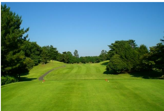
7月1日(日) リニューアルオープン セントラルゴルフクラブ 麻生コース (茨城県) ※麻生カントリークラブから名称変更予定

この度新しくアコーディア・ゴルフブランドとして生まれ変わった2つのコースへ是非、足をお運びください。