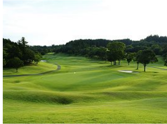
【18番ホール】