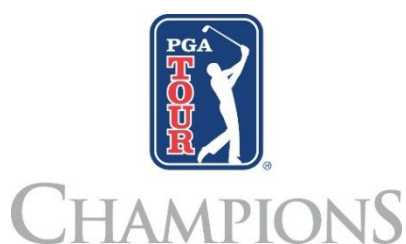
PGA TOUR Champions ロゴ

PGA TOUR チャンピオンズ、JAPAN AIRLINES Championship の詳細については www.PGATOUR.com をご覧ください。