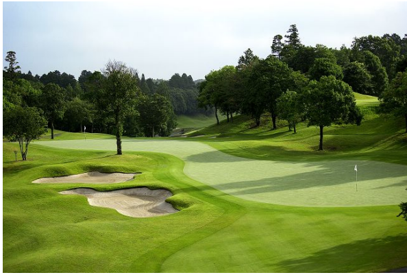
【6番ホール】

【成田ゴルフ倶楽部 画像】 ※使用の際は、アコーディア・ゴルフ広報までご連絡ください。