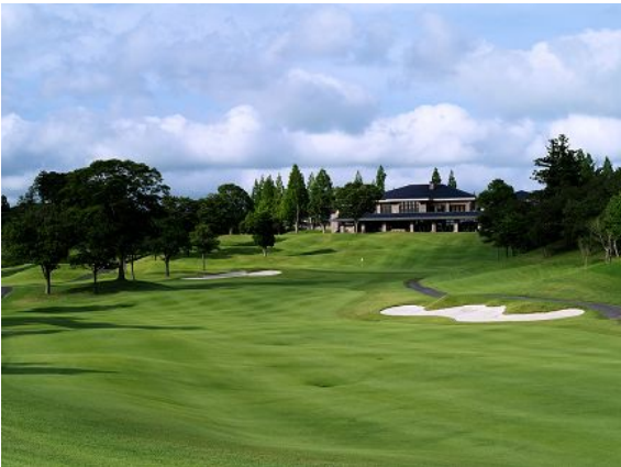
【18番ホール】