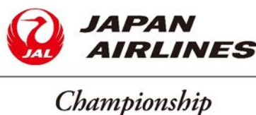
JAPAN AIRLINES Championship ロゴ