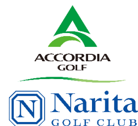
当トーナメントにおける 成田ゴルフ倶楽部ロゴ